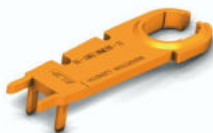
SOLARLOK 2.0 Entriegelungswerkzeug 8005409