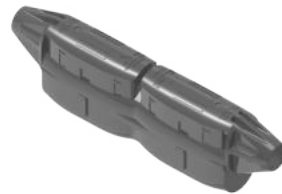
SOLARLOK 2.0 Verbinder 8006438