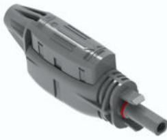
SOLARLOK 2.0 Buchse 8005407