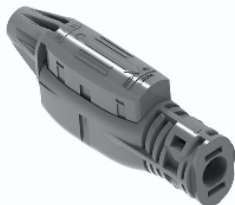
SOLARLOK 2.0 Stecker 8005406