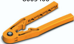
SOLARLOK 2.0 Zange 8005408